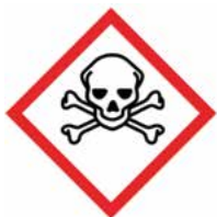
AKUT GIFTIG (FARLIGE)